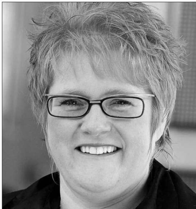
Venstres leder Trine Skei Grande.