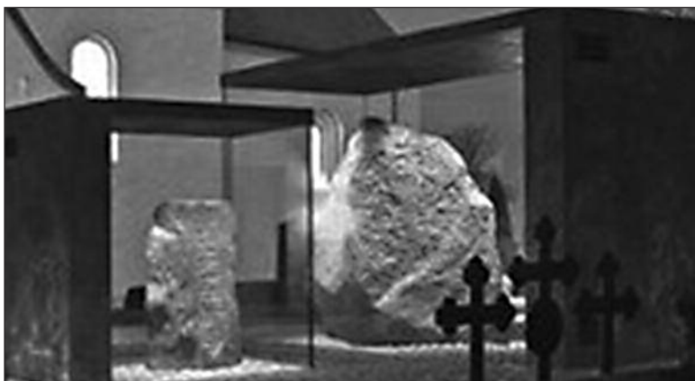
«Haraldskær – to stener til minne om Gorm den gamle, stedet for begyndelsen av et samlet Danmark»

Men det rigtigt ildevarslende ved denne proces er altså, at alt gøres for, at den kun kan gå én vej. Messerschmidt beskriver indsigtfuldt de nederdrægtige juridiske mekanismer bag, såsom at EU-Domstolen altid udtaler sig enstemmigt, og dens afgørelser virker derfor stærkt som præcedens i fremtidige sager, der igen bringer «integrationen» på europæisk plan et lille skridt videre. Og i modsætning til i faktisk alle nationale lovgivninger sker der ifølge Domstolen ingen forældelse af traktatbestemmelser – de bortfalder ikke, fordi de ikke bliver brugt, så der sker kun en vækst i overnational