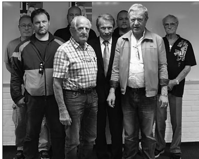
Noen av delegatene.

Deretter ble regnskapet gjennomgått. Det hadde et lite underskudd pga. betydelige investeringer siste år. Møtelederen redegjorde for noen detaljer, og regnskapet ble godkjent og styret meddelt ansvarsfrihet.