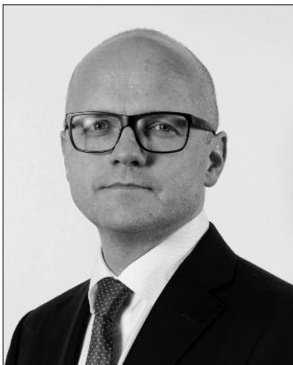
Europaminister Vidar Helgesen.

For eksempel brukte Stortinget bare fire minutter en desember-ettermiddag